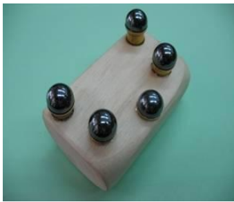
圖一 氣血活動促進器

握柄部分為圓弧型，方便手指緊握或施力。另外，上端排列多個的磁性球體，透過高低位置落差的設計，可以增加作用面積，且作用於人體表面時，能夠更貼合不同部位。(如圖一)